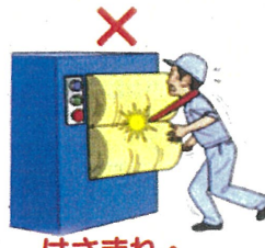
はさまれ・巻き込まれ災害