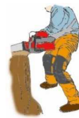
（図1）下肢の切創防止用保護衣

次の保護具等の選定に当たっては、防護性能が高いことはもちろんのこと、作業性が良く、視認性の高い目立つ色合いのものであって、人間工学に配慮した使いやすい機能を備えたものを選定すること。（① 下肢の切創防止用保護衣 （図1）、②衣服、③手袋、④安全靴等の履物、⑤保護帽、保護網・保護眼鏡及び防音保護具）